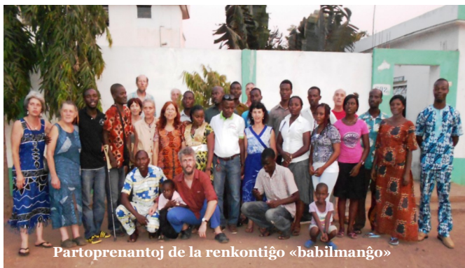
Partoprenantoj de la renkontiĝo «babilmanĝo»

La différence entre le début et la fin du cours est que tous les participants parlent l'Espéranto couramment! En plus, les relations d'amitié entre l'Afrique et la France se sont consolidées, des projets ont vu le jour en l'occurrence Nunaj Renkontiĝoj . Nouna est une petite ville du Burkina Faso. C'est la ville la plus proche d'Aurovillage, là où le groupe a séjourné et offert de nombreuses activités solidaires. Nunaj Renkontiĝoj est une nouvelle forme de rencontre qui vise à réunir les espérantophones d'Afrique et d'ailleurs, afin qu'ils puissent pratiquer la langue pendant une ou deux semaines à l'Aurovillage. La première rencontre se tiendra probablement en 2017.