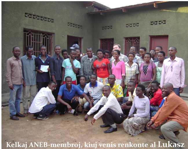
Kelkaj ANEB-membroj, kiuj venis renkonte al Lukasz

Demandoj leviĝis pri bezono de lernomaterialoj flanke de la vizitatoj kaj la prezidanto de ANEB promesis klopodi iel aranĝi. Siavice la prezidanto de TEJO starigis demandojn pri foresto de virinoj en la burunda movado. Laŭ interŝanĝoj kun la ĉeestantaj virinoj, ili ŝajne havas intereson pri Esperanto kaj pri partopreno en socia vivo ĝenerale, sed maloftas tiuj el ili kiuj kuraĝe