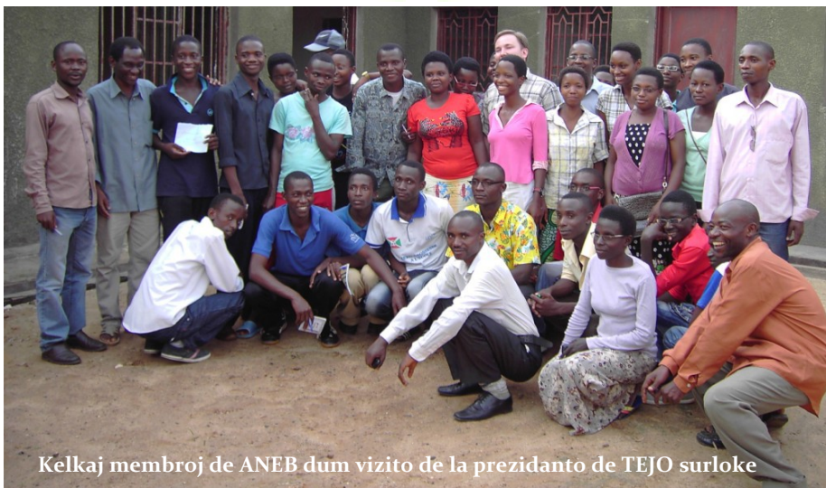
Kelkaj membroj de ANEB dum vizito de la prezidanto de TEJO surloke