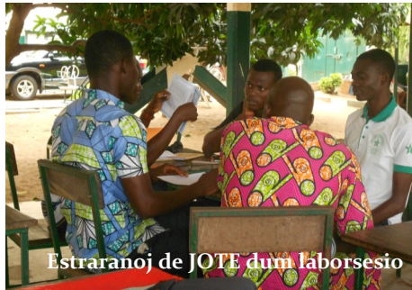
Estraranoj de JOTE dum laborsesio

Oni kune ankaŭ kunkantis la himnon ESPERO. Ĉi tiu ero estis prezentita de s-ro Doumegnon Koffi, kiu pli poste laŭvoĉe legis kaj legigis la regularojn de UTE. La materialo mem kuŝas en la retejo de UTE, sed oni antaŭe