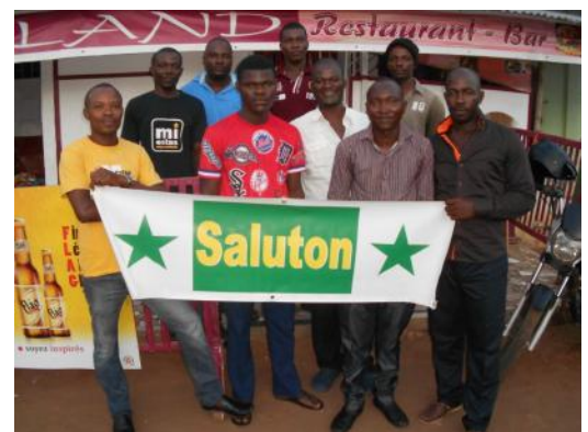
Kelkaj el la partoprenantoj

Babilmanĝo estas aranĝo de APETO kun amuza kaj eduka programoj, kiu celas kreskigi kaj fortigi la amikajn rilatojn inter Lomeaj Esperantistoj. Ĝi rolas ankaŭ kiel rendezvo por revidi unu la alian kaj renkonti laŭokaze alilandajn Esperantistojn. Temas pri vera forumo, kie ĉiuj havas