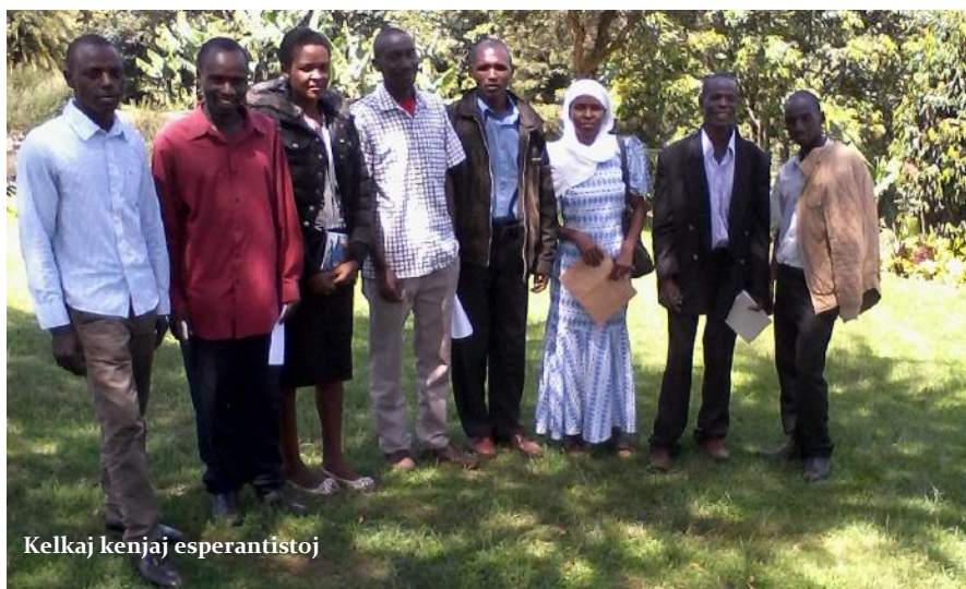
Kelkaj kenjaj esperantistoj

La tri specoj de agado en loka klubo estas: varbado, instruado kaj praktikado.